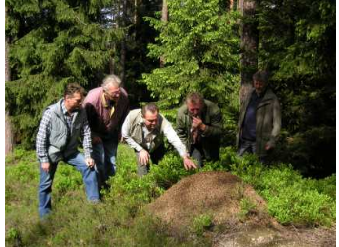
Mitglieder des Ameisenschutzvereins bei der Kartierung der Formica polyctena Kolonie in Münchsgrün